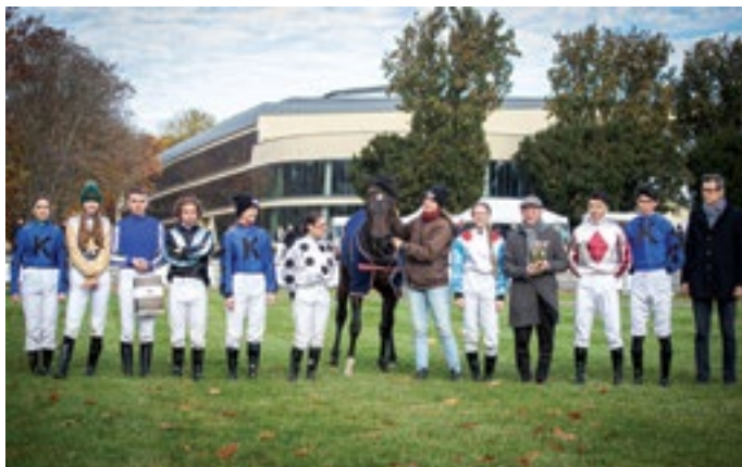
Służewiec, 3.11.24, Uczestnicy gonitwy uczniowskiej

Cykl Gonitw Uczniowskich przeznaczony jest dla uczniów i starszych uczniów, czyli jeźdźców wyścigowych, którzy mają na swoim koncie mniej niż 25 zwycięstw. Dzięki temu młodzi adepci trudnej sztuki jeździeckiej mogą doskonalić swoje umiejętności w konkurencyjnym, ale wyrównanym gronie.